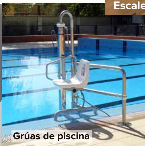
Grúas de piscina