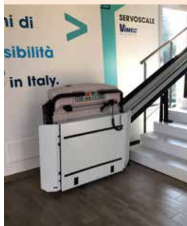
PETC-64 con barras retráctiles