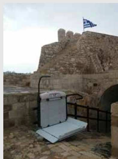
PETR-64 con apertura automatizada