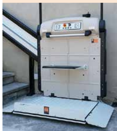
PETC-64 con asiento