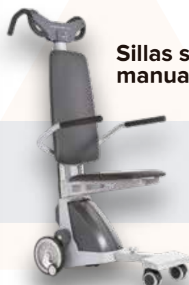
Sillas salvaescaleras manuales