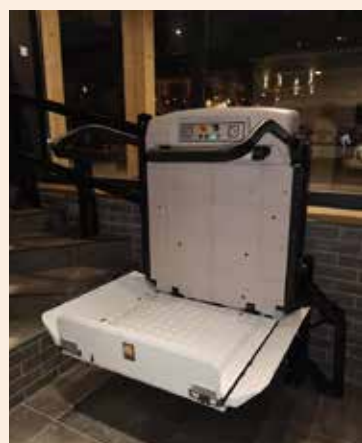
Comodidad y seguridad en cada tipo de viaje