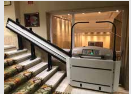
Congreso de los Diputados, Madrid