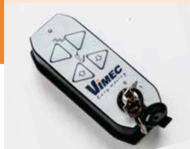
Mando via radio